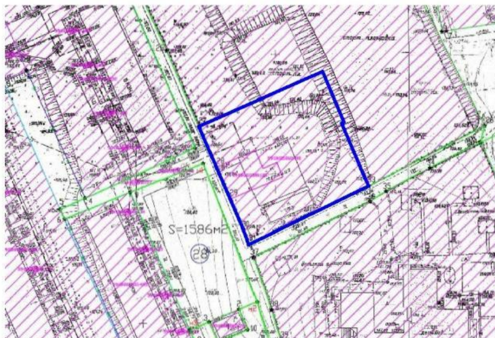
Рисунок 3. Выкопировка из документации по планировке территории: «Проект планировки и проект межевания территории многоквартирной жилой застройки в г. Добрянка Пермского края. Проект межевания территории многоквартирной жилой застройки г. Добрянка Пермский край»