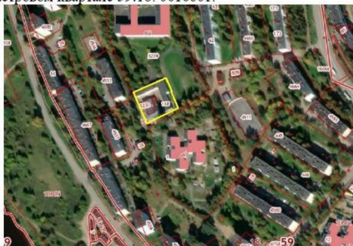
Рисунок 4. Фрагмент публичной кадастровой карты.

По данным ФГБУ «Федеральная кадастровая палата Федеральной службы государственной регистрации, кадастра и картографии» по Пермскому краю территория ограниченная участком расположенного по адресу Пермский край, г. Добрянка, пер. Строителей, дом 7, с кадастровым номером 59:18:0010601:118 находится в кадастровом квартале 59:18: 0010601.