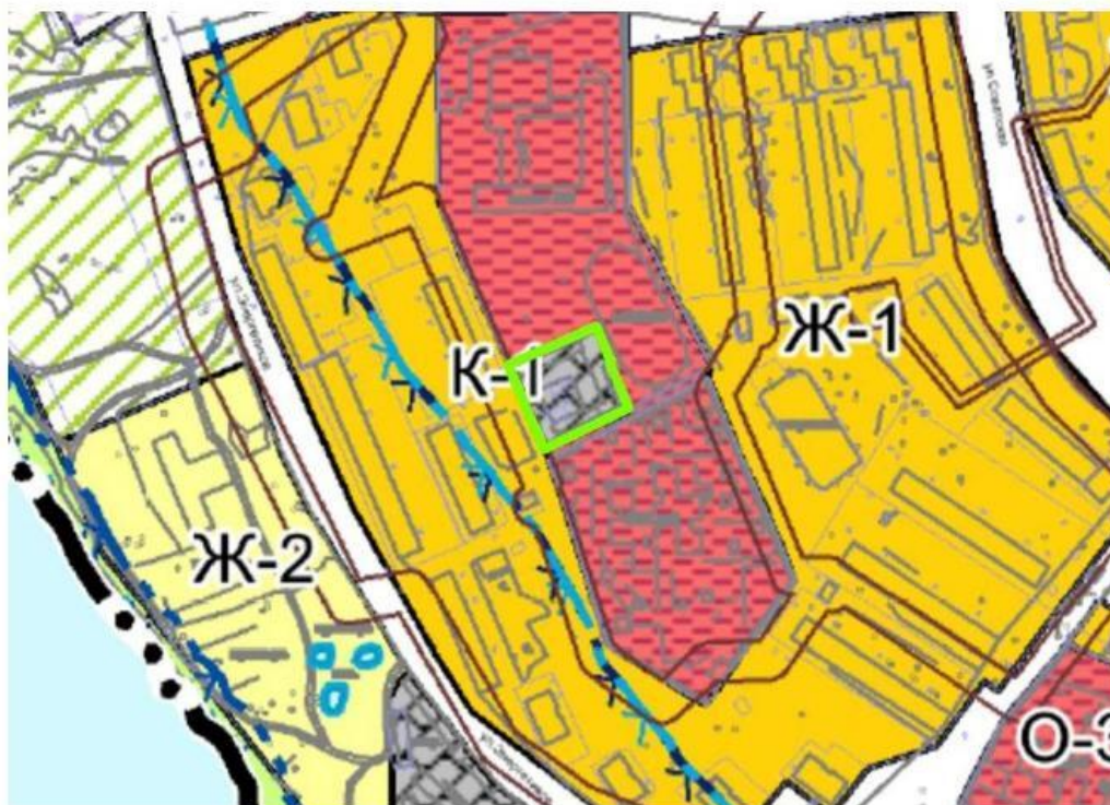
Рисунок 2. Фрагмент карты градостроительного зонирования правил землепользования и застройки Добрянского городского поселения Добрянского муниципального района Пермского района.

В соответствии с правилами землепользования и застройки Добрянского городского поселения Добрянского муниципального района Пермского края утвержденные решением Думы Добрянского городского поселения от 20 ноября 2015 г. № 280 проектируемая территория находится в зоне коммунальных объектов (К-1).